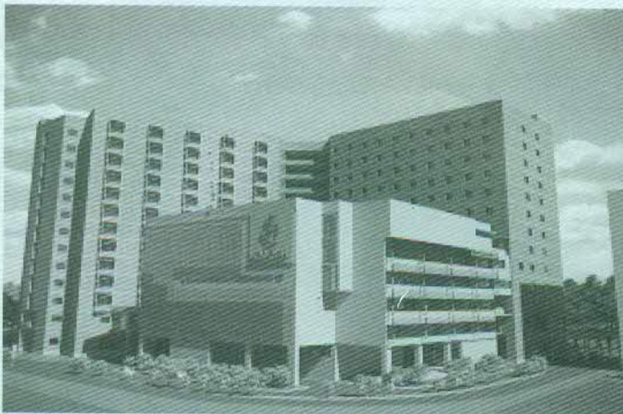
প্রস্তাবিত চট্টগ্রাম মা ও শিশু হাসপাতাল ভবন