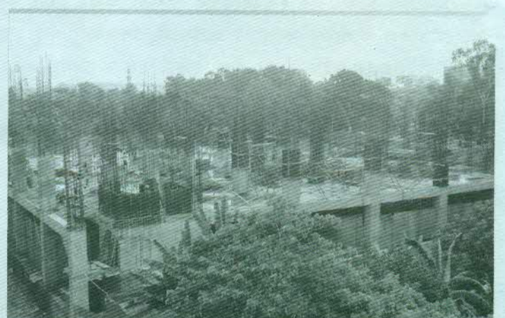
নির্মাণাধীন নতুন হাসপাতাল ভবন